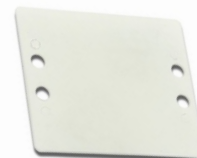
TYP - D